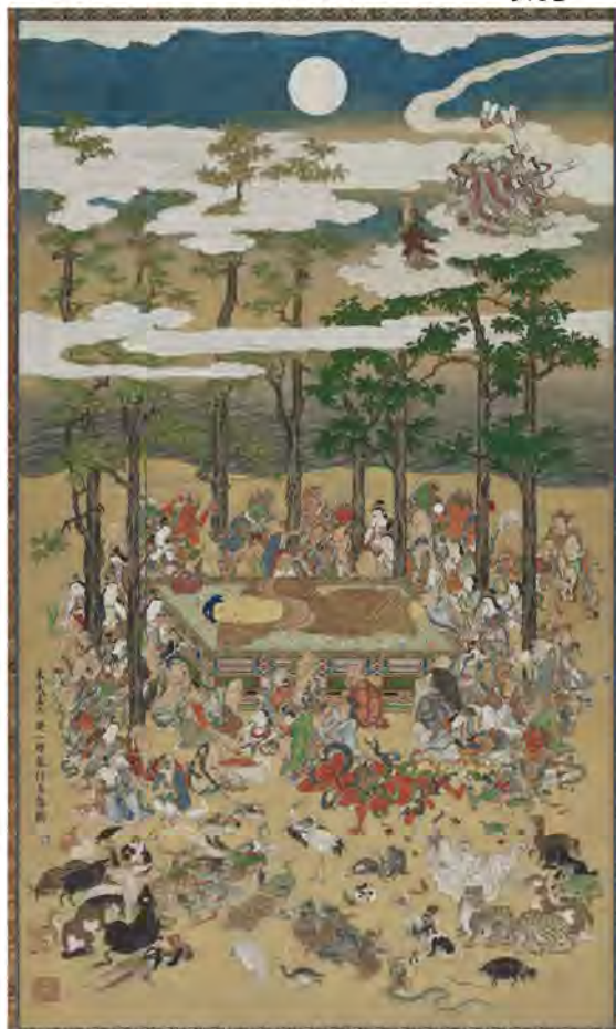
英一蝶《涅槃図》正徳3年（1713年） Fenollosa-Weld Collection, 11.4221

動物たちにも お話を聞いて みましょう！ みなさんどちらから 来られたんですか？